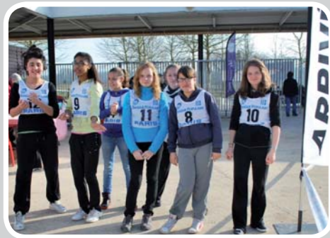
Sport en filles