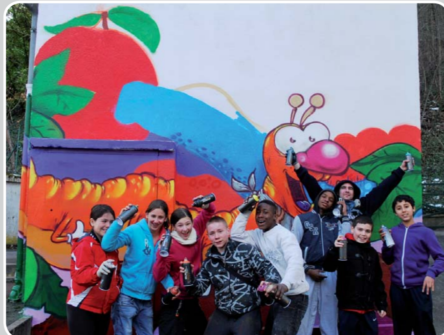
La fresque terminée !