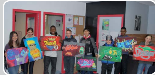
Réalisation d'une maquette par chacun des participants !