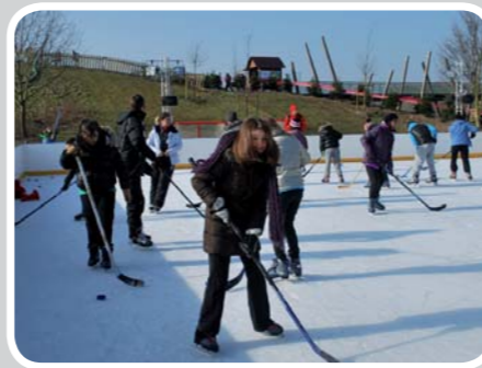
Hockey sur glace