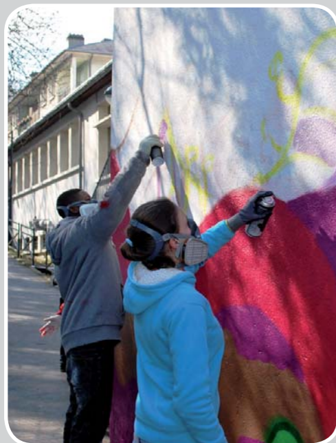
Réalisation de la fresque rue Serpente