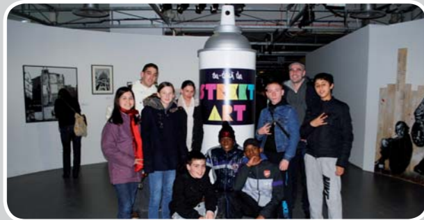
Visite de l'exposition « Au delà du Street art » au musée de la Poste à Paris

Atelier graff ou comment les jeunes Orcéens ont redonné vie à un vieux bloc EDF tagué ! Quand l'art devient une signature urbaine, la ville se personnalise et devient unique ! C'est notre ville !